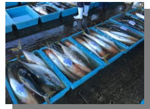
[ブリ水揚げの様子]

3月26日(土)、熊野灘の北部に位置する大紀町錦地区で「ぶいまつり」が開催されました。錦漁港は全国でも有数のブリの水揚げ量を誇ります。今回は、地元の漁協などが、そのおいしさをさらに発信するため、このイベントを開催しました。当日は県内外から多くのお客様が訪れ、新鮮なブリの刺身や名物の“ひろめ汁”が振舞われ、大盛況でした。皆様も、大紀町にお立ち寄りの際は錦のブリをご賞味ください。